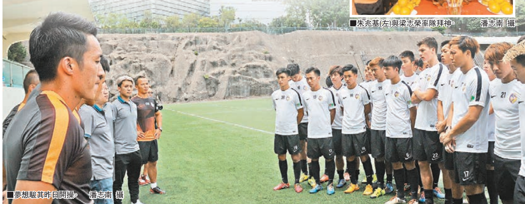
夢想駿其昨日開操。