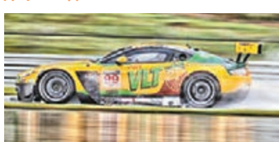
歐陽若曦練習時遇着大雨。

香港賽車手歐陽若曦(Darryl)早前在GT亞洲系列賽日本岡山站贏得第4回合季軍,協助効力車隊 Craft-Bamboo Racing 暫時高踞