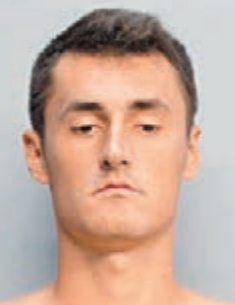
湯米奇已保釋。

最近麻煩事多多的澳洲男網球手湯米奇,日前又再挑起事端,周三在一間邁阿密沙灘酒店開派對時因聲浪太大被投訴,其後還被警方控以非法進入及拒捕罪名拘捕,事後該名22歲球手已承認犯錯。