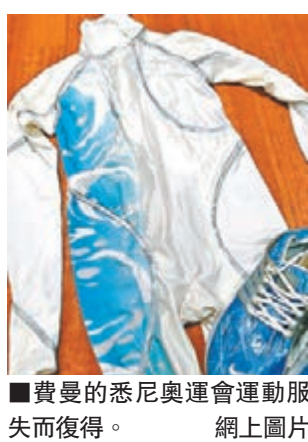
費曼的悉尼奧運會運動服失而復得。

已屆42歲的澳洲女子田徑名宿費曼昨日在社交網站 twitter 報喜,指出15年前遺失的悉尼奧運會開幕禮運動服失而復得。費曼在2000年悉尼奧運負責點燃主火炬,當年身穿的運動服事後在奧運主場館的更衣室內不翼而飛。去年12月,這套運動服被匿名郵寄到墨爾本板球場博物館,經過多番鑑定後,證明是屬於該屆女子400米跑金牌得主費曼。費曼在 twitter 貼文說:「終於與我的2000年悉尼奧運會開幕禮運動服重逢,感謝有份協助送回的所有人。」