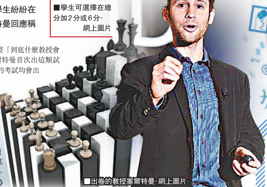
出卷的教授塞爾特曼。