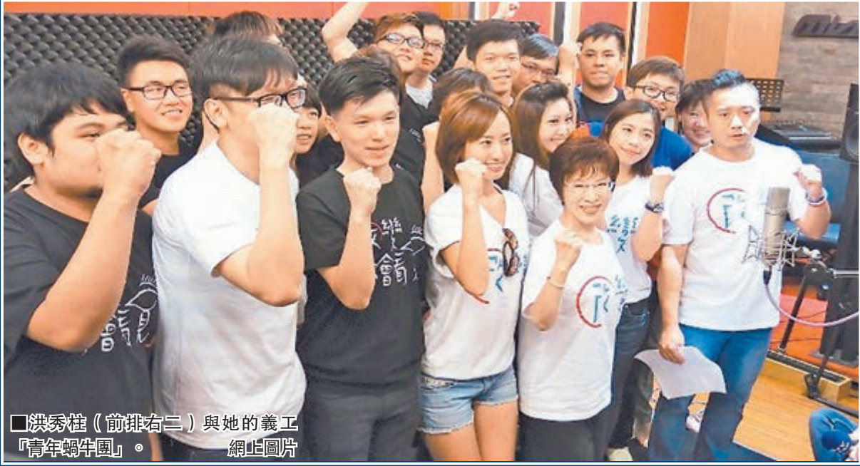
洪秀柱(前排右二)與她的義工「青年蝸牛團」。

另外，洪秀柱獲提名在即，洪陣營「青年蝸牛團」也動起來，陸續完成洪秀柱網絡拚戰圖。除臉書(Facebook)、LINE外，洪秀柱 tumblr (輕博客網站，介於傳統博客和微博之間的全新媒體形態) 正式上線，取名「台灣秀 Taiwan 惜台灣」。