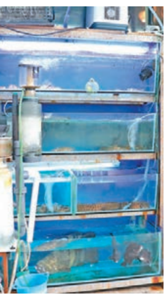
■食肆上、中兩層魚缸內大隻的龍蝦膏蟹全遭人撈走。

香港文匯報訊(記者 劉友光)旺角一間主要做熟客夜市及消夜的私房菜館，昨日凌晨臨打烊前，店員發現放在門口魚缸內一批龍蝦及膏蟹不翼而飛，懷疑被「饞嘴賊」偷走，損失總值約2,000元。女店東不排除是附近熟悉其菜館運作的人士所為，會考慮安裝閉路電視加強保安。警方已列作「盜竊」案調查，暫無人被捕。