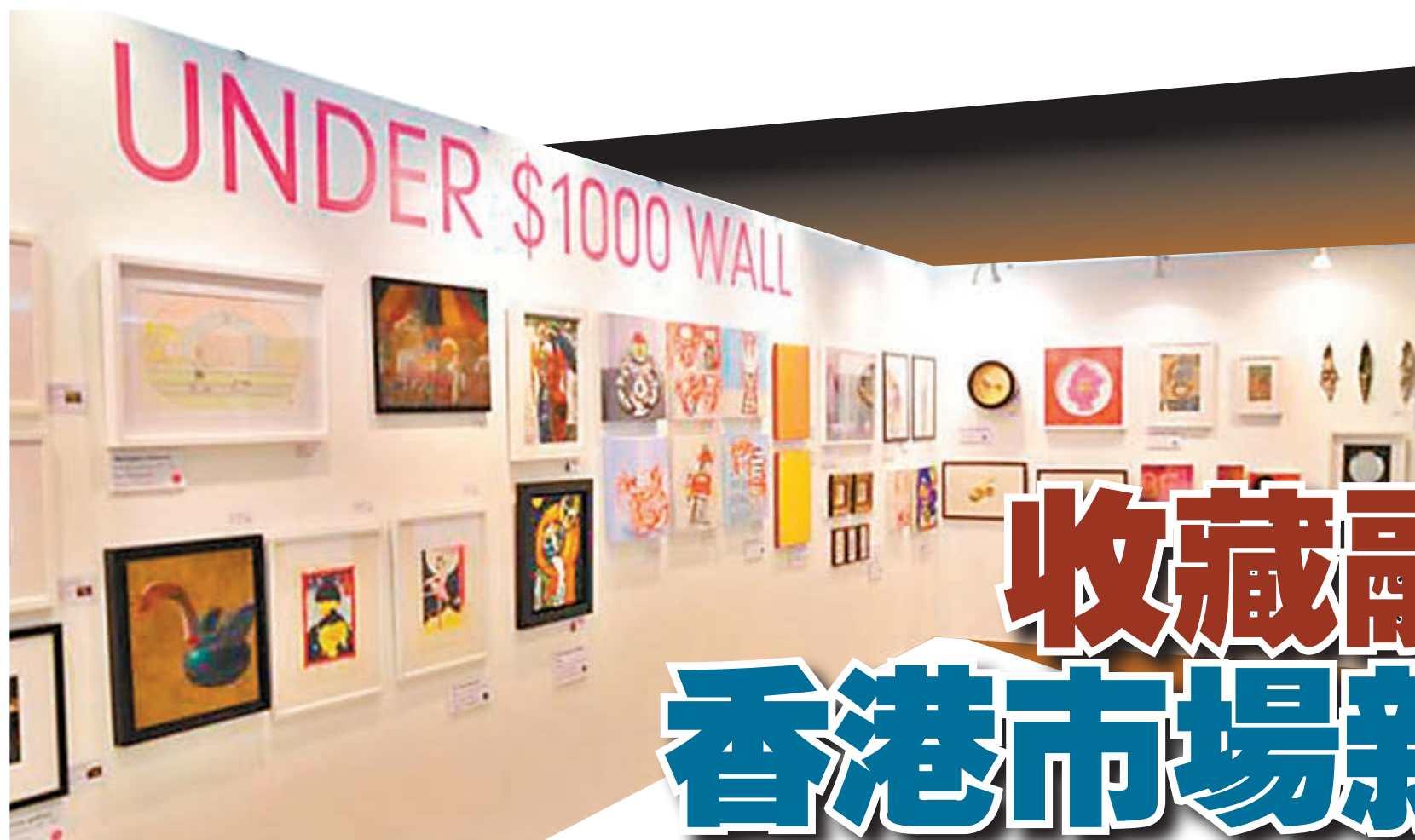
■Affordable Art Fair 目前成為香港藏家關注藝術博覽會。