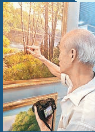
■77歲老人用專業角度為記者講解山水畫。