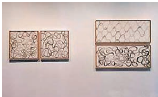
■獅語畫廊在巴塞爾為藏家帶來當代藝術。