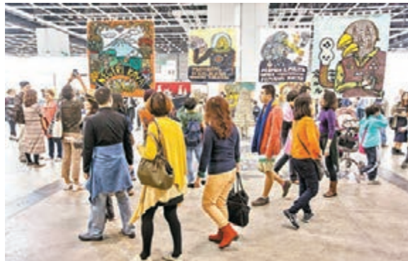
■今年巴塞爾匯攏了超過6萬觀眾的人流。