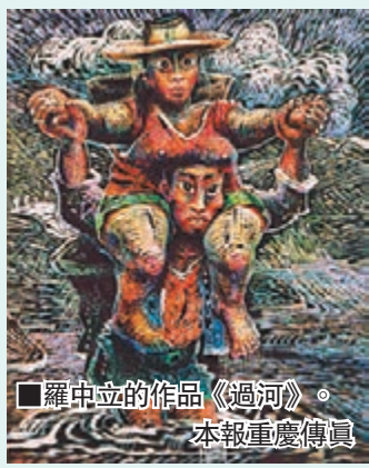
■羅中立的作品《過河》。

此外,重慶文化產權交易中心還通過一系列制度設計,對交易參與主體實行實名會員制管理,對上市藝術品實行漲跌幅限制、停牌、要約交易、退市等控制,並引入了擔保機構,防止市場風險,保障投資人的合法權益。