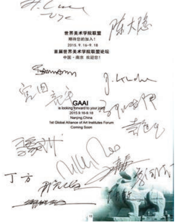
國內外各大美院院長在聯盟手冊上簽字表示關注支持共同發展。

給第二屆南京國際美術展學術支持帶來了新的高度，也標誌着世界美術學院聯盟朝着更專業更系統的方向發展！