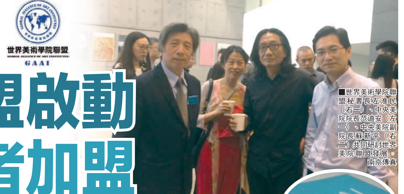
世界美術學院聯盟 GAAI

香港文匯報訊（實習記者 王穎 南京報道）世界美術學院聯盟（GAAI）日前正式啟動，聯盟由南京國際美術展組委會提議，包括中國知名藝術院校在內的世界著名藝術院校共同發起，是在香港註冊成立的非營利性國際學術組織。