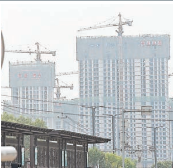
■房地產開發投資增速比1-5月份回落0.5個百分點。圖為山西太原一處正在建設中的樓盤。

此外,盛來運還指出,二季度以來,房地產市場無論投資、價格、銷售,情況比較好的還是一線城市和少數的二線城市,因為這些城市剛性需求和改善性需求都比較旺盛,所以房地產表現更積極一些。但是,多數的二線城市、三線城市,尤其是一些四線城市,由於原來的房地產存量大,消化起來需要有一個過程。