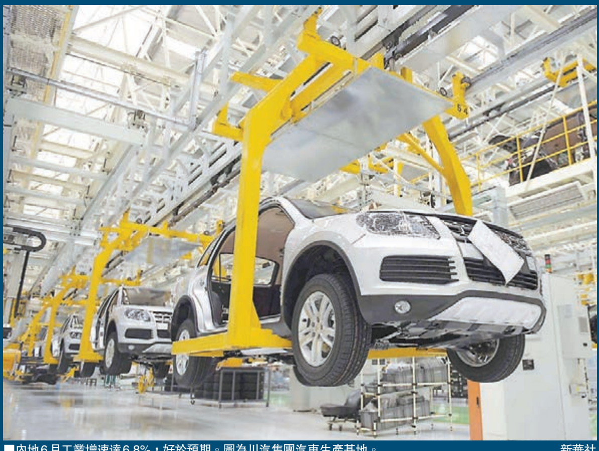
■內地6月工業增速達6.8%,好於預期。圖為川汽集團汽車生產基地。