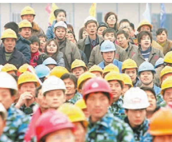
■內地農民工出現高齡化趨勢。資料圖片

針對進城務工的農民,二季度末,農村外出務工勞動力總量1.74億人,同比增加18萬人,增長0.1%。上半年,外出務工勞動力月均收入3,002元,同比增長9.8%。國家統計局新聞發言人盛來運表示,目前中國農民工規模比較大,總量達到了2.74億人,佔全國人口總量的比例超過五分之一。但農民工的外出總量增速從過去兩位數回落到一位數,二季度末農村外出務工勞動力總量增長了0.1%,是近期的一個低點。「現在農村中的年輕勞動力該出來的都出來了,」盛來運說。從結構來說,農民工高齡化趨勢有所加快。2010年,農民工平均年齡是35.5歲,2014年平均年齡是38.3歲,平均每年提升0.6個百分點,50歲以上的農民工數量和比重都在加快提升。