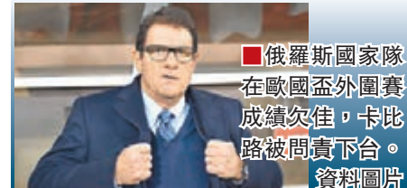
俄羅斯國家隊在歐國盃外圍賽成績欠佳，卡比路被問責下台。資料圖片