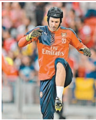
施治今晚有望首度為阿仙奴上陣。法新社