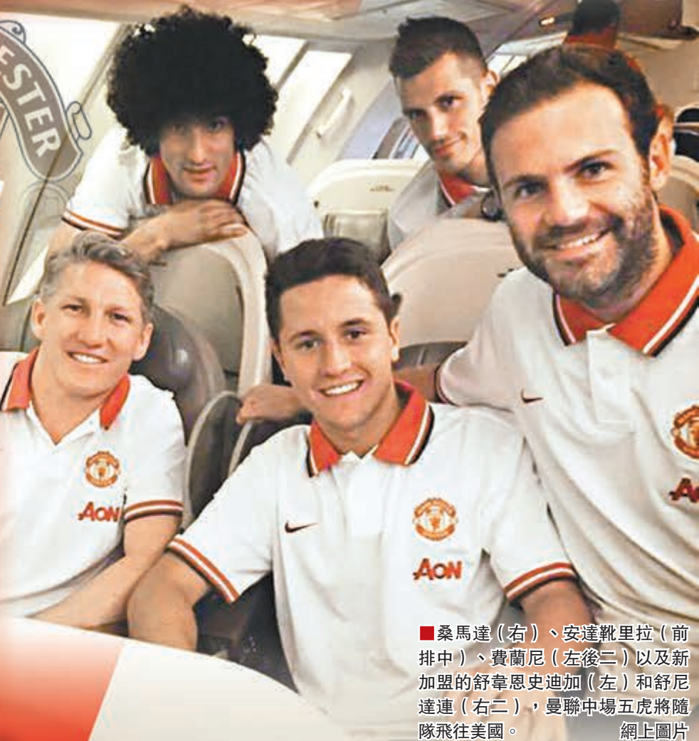
桑馬達(右)、安達靴里拉(前排中)、費蘭尼(左後二)以及新加盟的舒韋恩史迪加(左)和舒尼達連(右二)，曼聯中場五虎將隨隊飛往美國。