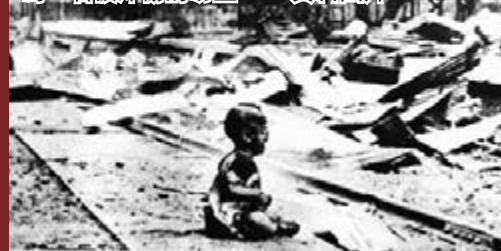
1937年8月28日，日軍對上海南站狂轟濫炸，炸死200餘人。圖為一名被炸傷的幼童。