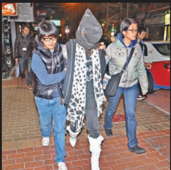
早前有雙失16歲少女涉嫌販毒被扣查，引起社會廣泛關注這一族群對個人、家庭、社會的影響。資料圖片