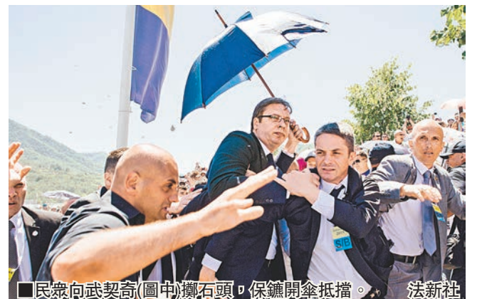
民眾向武契奇(圖中)擲石頭，保鏢開傘抵擋。

波斯尼亞和黑塞哥維那昨日舉行儀式，紀念斯雷布雷尼察大屠殺20周年，多國領袖出席，包括當地人視為結束內戰功臣的美國前總統克林頓，以及塞爾維亞總理武契奇。由於塞爾維亞當年一直支持波斯尼亞塞族部隊，被指是這場造成8,000名穆斯林死亡的大屠殺幫兇，武契奇昨日在活動上遭激烈抗議，甚至被石頭擊中頭部，眼鏡碎裂，要提早離場。