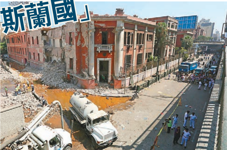
意國領事館嚴重損毀。