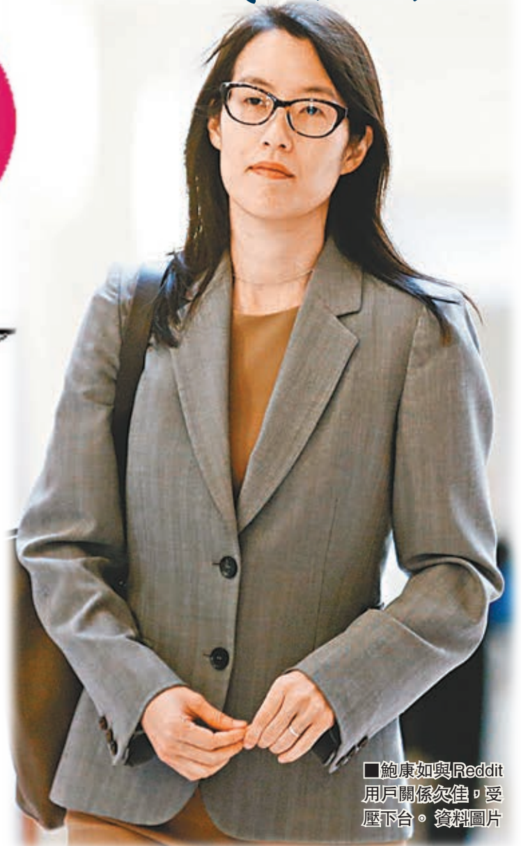
鮑康如與Reddit 用戶關係欠佳，受壓下台。資料圖片

Reddit 前日發表聲明，宣布經雙方同意，鮑康如將離職，但會繼續擔任董事會顧問直至年底。Reddit 共同創辦人兼前總裁赫夫曼將重返公司接任總裁一職。鮑康如前日在 Reddit 發帖，形容在任期間「見過很多好事、壞事及醜陋的事」，強調自己只是一個普通人，有感情也有家庭，認為那些辱罵她的網民應顧及他人感受。