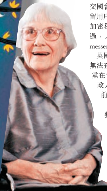
《設立守望者》(左圖)是哈珀·李於1950年代初寫成。網上圖片