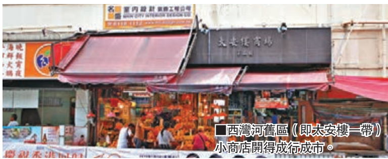
西灣河舊區(即太安樓一帶) 小商店開得成行成市。