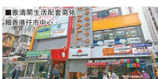
雅濤閣生活配套需依賴香港仔市中心。