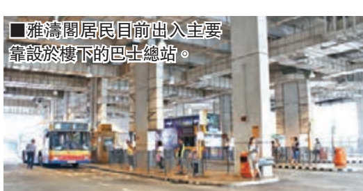
雅濤閣居民目前出入主要靠設於樓下的巴士總站。