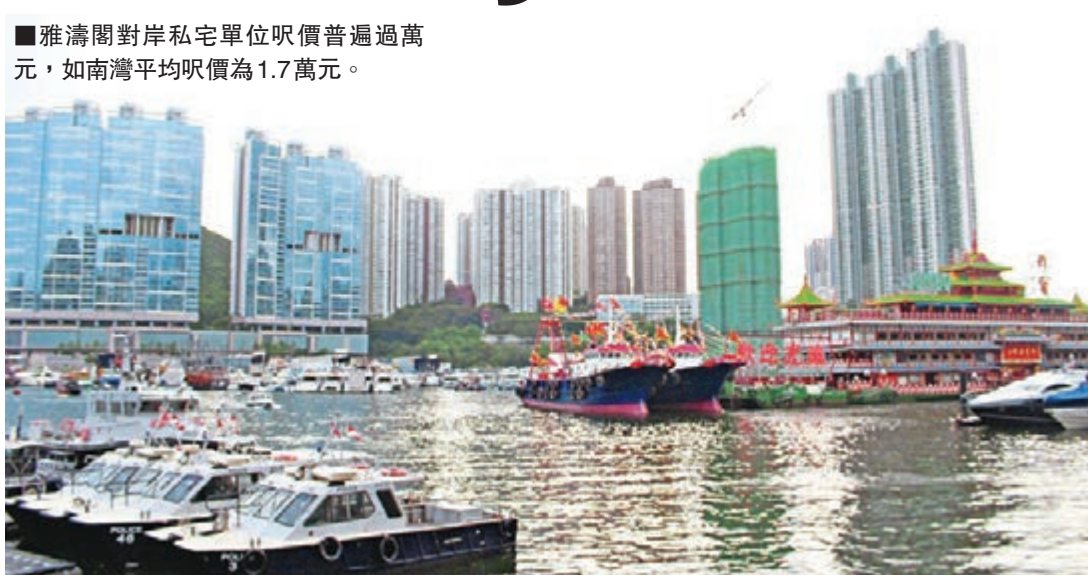
雅濤閣對岸私宅單位呎價普遍過萬元，如南灣平均呎價為1.7萬元。