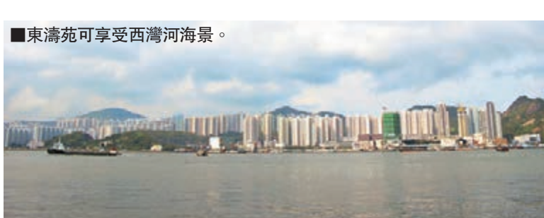
東濤苑可享受西灣河海景。