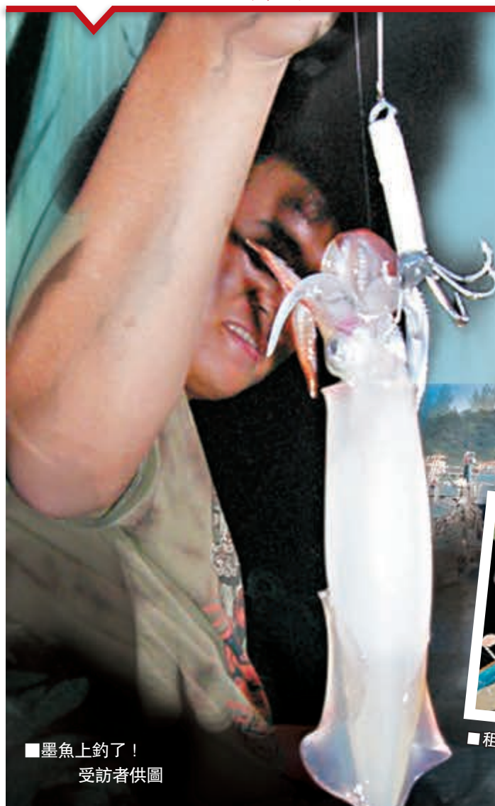
■墨魚上釣了！