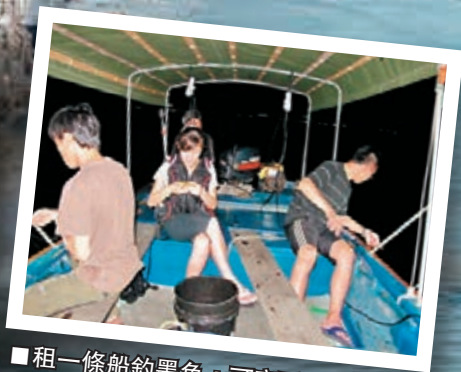
■租一條船釣墨魚，可享受打魚樂趣。