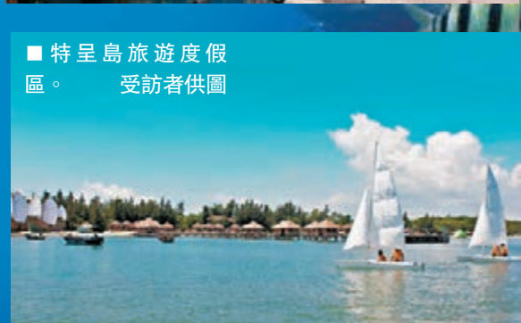
■特呈島旅遊度假區。