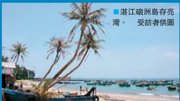
■湛江硇洲島存亮灣。