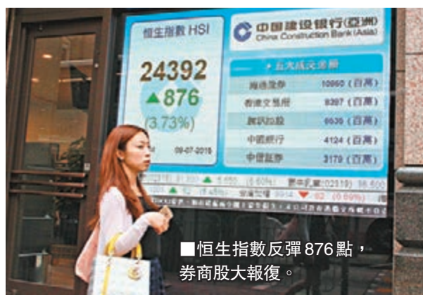
恒生指數反彈 876 點，券商股大報復。