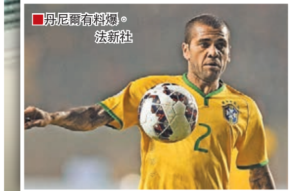
■丹尼爾有料爆。

至於在德國，拜仁日前操練時，主帥哥迪奧拿據報跟湯馬士梅拿發生了拗氣，事實上去年季列貝利與洛賓受傷下，拜仁的攻力即有所減弱。哥帥指梅拿「一對一的過人能力不夠」，而曾取得世界盃神射手獎的德國鋒將卻不滿西班牙人的戰術安排，成為兩人不和的導火線。數月前歐聯4強賽，梅拿已試過在被換出後於後備席邊向哥帥發脾氣，難怪昨傳曼聯已密切留意住他了。 ■記者 梁志達