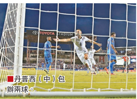
■丹普西(中)包辦兩球。

昨晨中北美洲金盃足球賽開戰，首輪分組賽，東道主美國隊藉頭號攻擊手丹普西上下半場各入1球，以2:1力克洪都拉斯，以勝利開啟衛冕征程。「這不是我們踢得最好的一場比賽，但首次拿到3分，我們很開心，」丹普西說。美國隊過去5屆金盃全部闖入決賽，3次贏得冠軍。共有16位球員參加了去年巴西世界盃。 ■新華社