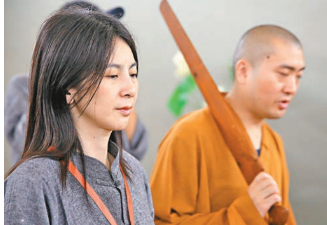
上海心靈培育 上海玉佛禪寺昨日首度推出「玉佛問禪」禪修課,報名火爆,可謂「一座難求」。當天,70名體驗者進寺院參加為期兩天的禪修課,他們交出手機,換上灰色的麻質禪修服,聆聽法師開示。禪修,意為「心靈的培育」。

香港文匯報訊(記者 郭建麗、實習記者 白明珠 內蒙古報導)記者日前從內蒙古人社廳獲悉,內蒙古公務員工資調整工作,完全按照國家的相關規定嚴格部署落實。據介紹,本次公務員工資調整有三個特點,一是與機關事業單位養老保險制度改革同步進行。二是重在優化工資結構。三是進一步體現工資待遇向基層傾斜。