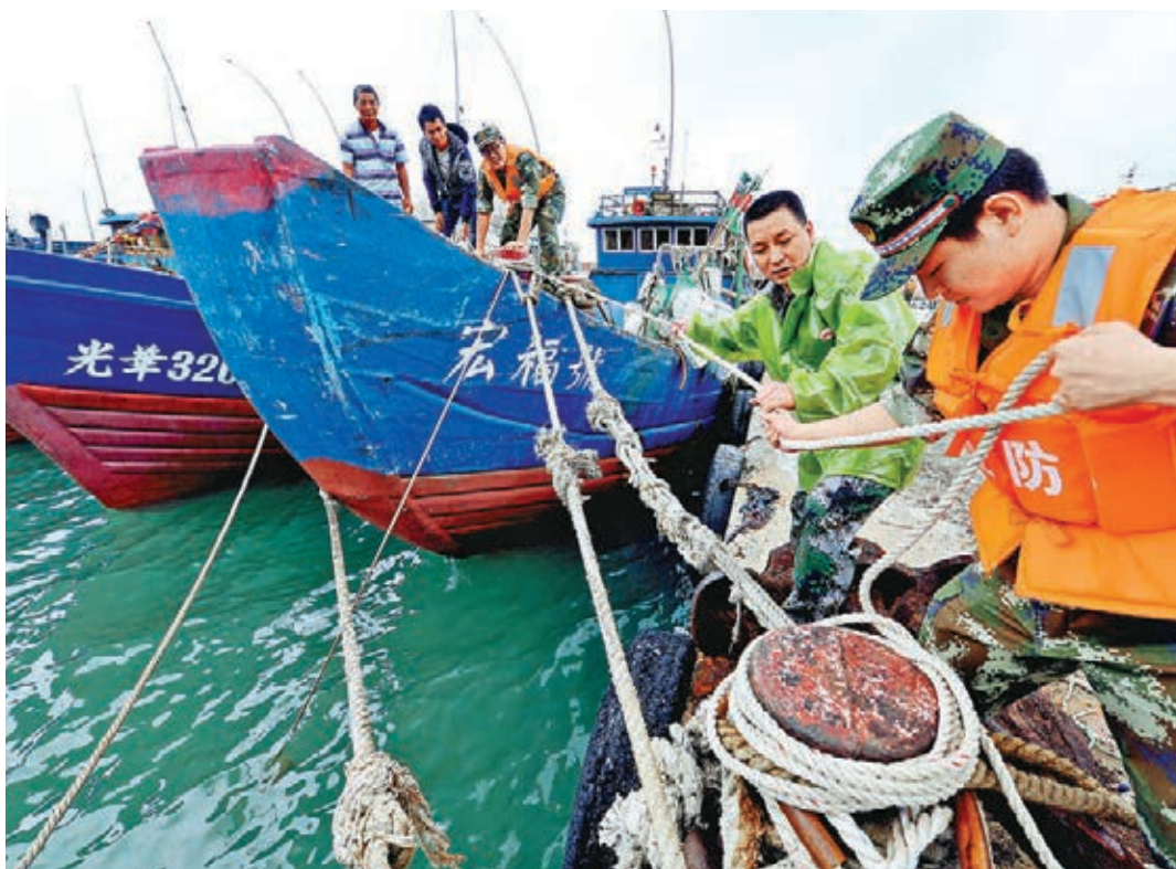
罕見三颱風來襲,各地加緊做好防護措施。圖為人們在福州黃岐碼頭固定漁船。

福建省交通運輸廳昨日稱,為確保旅客安全,昨日起廈門—金門、泉州—金門、馬尾—馬祖等3條「小三通」客運航線停止營運,廈門—基隆、廈門—台中以及平潭—台北、平潭—台中等4條直航台灣本島客運航線也已全部停航。浙台(玉環)經貿合作區管委會表示,「台台直航」—浙江省台州市玉環縣大麥嶼港對台海上直航將於今日至12日停航。受「燦鴻」影響,目前滯留