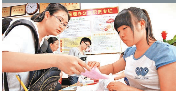
國家助學貸款最長期限統一延長至20年。圖為工作人員(右)為貧困大學生辦理生源地信用助學貸款手續。

香港文匯報訊 國家助學貸款最長期限將由原先的10年、14年,統一延長至20年,並將建立還款救助機制等。