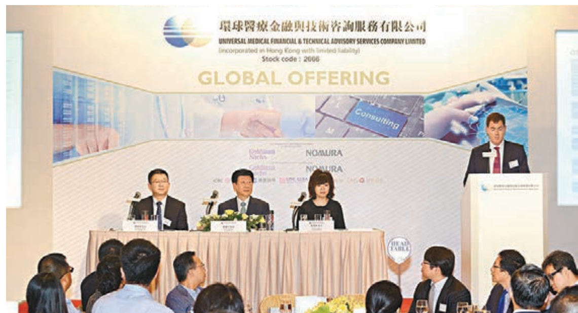
中國最大型綜合醫療服務供應商——環球醫療今日港交所主板掛牌