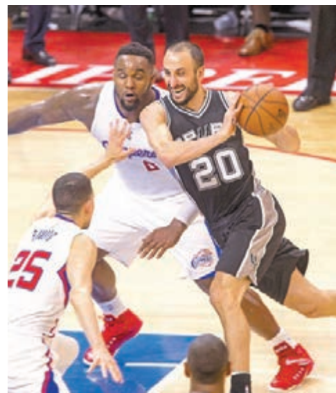
贊奴比利(右)決定留隊。

贊奴比利昨日在Twitter上正式宣佈，他將繼續為聖安東尼馬刺效力。在簽下自由球員市場上最受矚目的艾德列治後，贊奴比利去留就是馬刺的主要目標。先前贊奴比利曾表示，鄧肯的動向有可能影響他的決定，而日前鄧肯已經決定留在馬刺，昨日贊奴比利也終於鬆口。「很高興宣佈，我下個球季會留下。」贊奴比利在自己的Twitter上如此寫道。本月底將滿38歲的贊奴比利，生涯13個球季都在馬刺渡過，在865場出賽中交出均14.3分、3.8籃板及4.0助攻的成績。