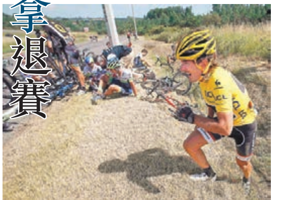
簡索拉拿(右)炒車後，仍回到賽道上比賽。