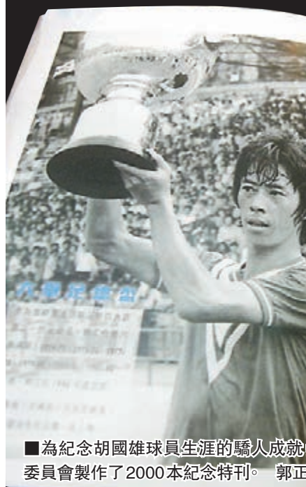
為紀念胡國雄球員生涯的驕人成就，治喪委員會製作了2000本紀念特刊。