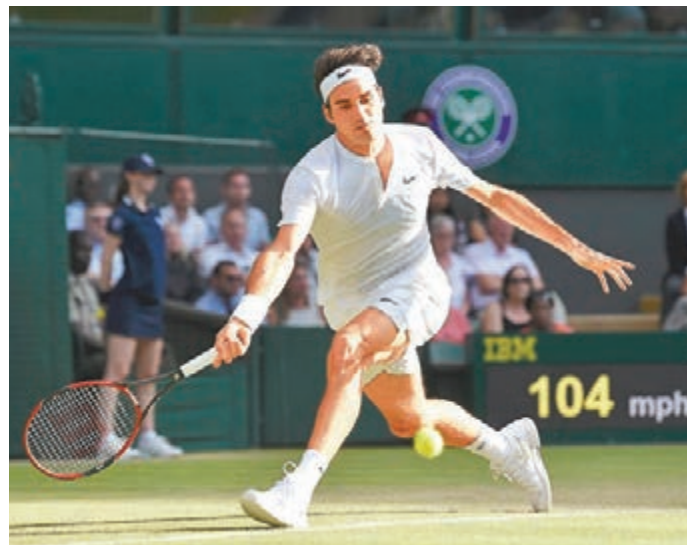
費達拿在比賽中擊球。

歷。女單方面，5號種子「丹麥甜心」禾絲妮雅琪則意外地以兩盤4:6不敵西班牙的梅古露莎，未能進入8強。 ■記者 鄺御龍