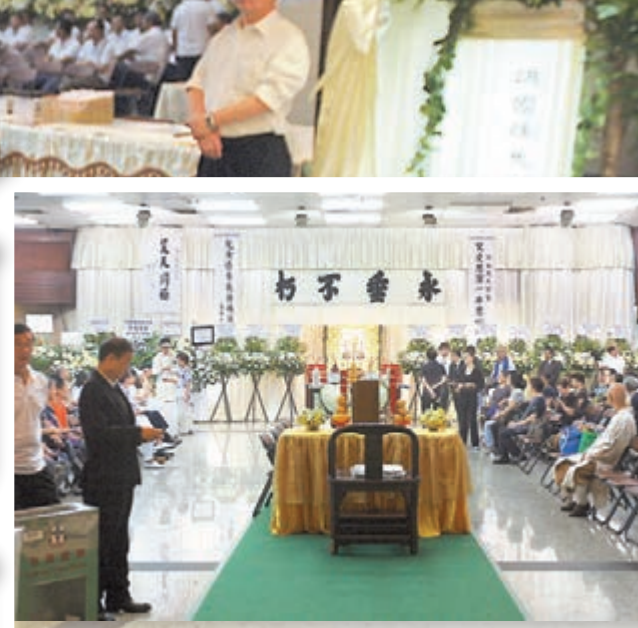
胡國雄靈堂佈置以簡約為主。

香港文匯報訊(記者 郭正謙)香港一代球王胡國雄昨日於紅磡世界殯儀館舉行公祭，過百名球迷、球壇人士等均有到場送別這位香港最強「10號」，他們均讚揚胡國雄技術人品俱佳，無愧一代球王之名。公祭現場氣氛莊嚴肅穆，彰顯人稱「大頭仔」的胡國雄生榮死哀。