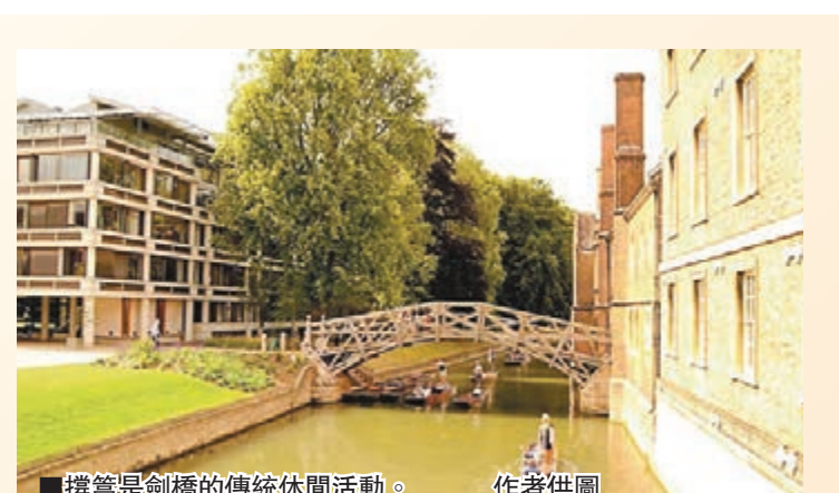
■撐篙是劍橋的傳統休閒活動。

我不會撐篙，卻熱衷於遊船。夏日微涼的傍晚，約同伴三兩人，租平底船一隻，在康河上由南往北，由北往南地徜徉。遊船有了經驗，一手提牛皮紙袋，裝上蘋果乳酪，一手搭件薄外套，穿着寬鬆