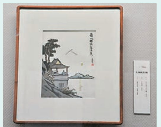
豐子愷漫畫《幾人相憶在江樓》。

豐子愷是我國抒情漫畫的創始人，被譽為「中國漫畫的鼻祖」，早年曾師從「弘一法師」李叔同學習繪畫。「五四運動」以後，開始進行漫畫創作。豐子愷將西方繪畫技巧與中國傳統文化巧妙融為一體，兼受日本畫家竹久夢二影響，逐漸形成自己「融匯中西」的漫畫藝術風格。