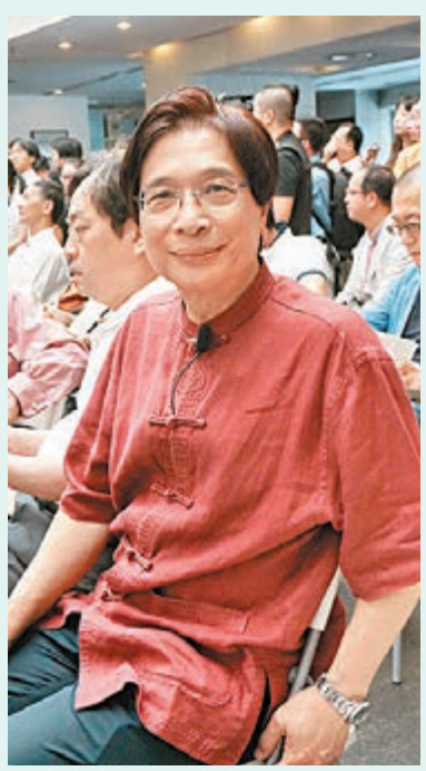
當今嶺南畫派佼佼者司徒乃鍾。

記者從廣東美術館館長羅一平處獲悉，此次展覽選取廣東開平籍四位藝術家的藝術作品進行收錄和整理，既是對20世紀早期的中國藝術史在東、西方繪畫、雕塑剖面的分析和涵蓋，同時也是縱向地觀察過去的歷史到今天所發生的變化。梳理開平僑鄉所孕育出的獨特文化氣質，以個案的微觀視角看待廣東籍藝術脈絡蜿蜒的承接與呈現。