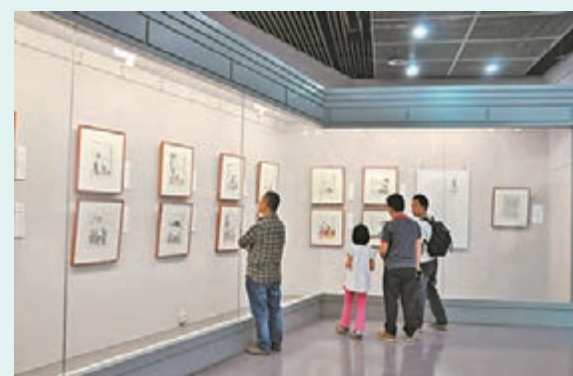
鄭州市民參觀畫展。

儘管豐子愷一生飽經戰爭和動亂，但始終都保持著一顆童心，以樂觀直率的風格進行創作。他的漫畫，風格樸實幽默，雖然看來平淡無實但意境深遠，充滿現實主義的人文情懷，早期作品多表達對現實的諷刺，後期則常作古詩新畫，特別偏愛兒童題材。而此次展出的正是豐子愷藝術生涯最後的畫集，更是對他一生的提煉。