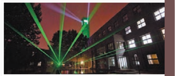
畢業季上的燈光秀。