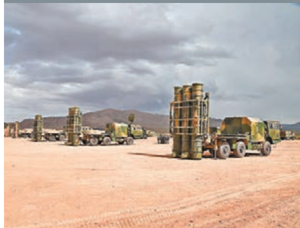
演習中,陸軍新型防空導彈陣演練場。

香港文匯報訊 據新華社報導,代號為「火力-2015青銅峽·A」的陸軍炮兵旅跨區基地化演習昨日凌晨在蘭州軍區某訓練基地打響,由此拉開了解放軍今年組織的7場陸軍炮兵旅跨區基地化實戰演習系列演習的序幕。