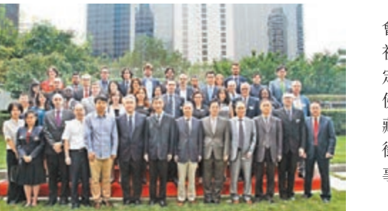
參加研修計劃的國外青年漢學家。