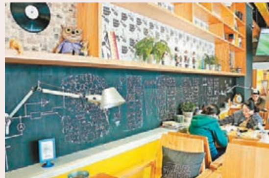
學生設計的4A創業咖啡館塗鴉牆。