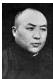
■謝振平獲追封烈士。

從命令抗戰到底；我又是北平市一局之長，必將與北平共存亡。」不料一語成讖，8月14日晚，謝振平在北新橋大頭條寓所和29軍在北平的高級幹部會商對策時被日偽軍帶走。在日寇的嚴刑拷打下，謝振平未曾透露受傷抗日將士的地點，因此很快被殺害。