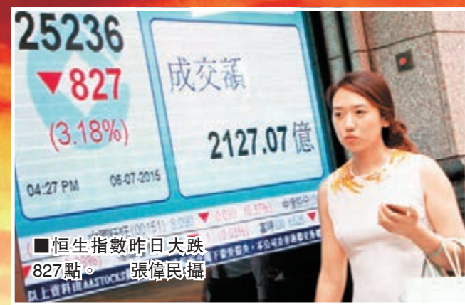
217隻牛證打靶 11萬期指未平倉

香港文匯報訊(記者 周紹基) 希臘危機升級，中央雖傾力救A股，港股卻成爲代「沽」羔羊，牛屍遍地，血流成河。恒指昨日一度暴瀉逾千三點，收報25,236點，急挫827點或3.18%，跌幅爲四年來最大。大市跌幅全面，共1,743隻股份下挫；217隻牛證打靶，爲歷來第二多；港股市值一日蒸發1.1萬億元，以全港225.3萬股民計，相當每人輸掉48.82萬元，十分慘烈。晚上外圍港股回穩，截至今晨00:35，ADR港股指數報25,387點，升150點。港股夜期收報25,421點，高水185點。