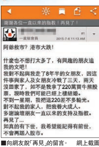
向網友說「再見」的留言。網上截圖

有經紀透露，大市波動，大部分客戶以觀望態度爲主，沒有急着散貨。反而有客人在尾市以20萬元現金買入港交所(0388)、中移動(0941)等藍籌股。信誠證券副總裁何智威認爲，現時不論希臘危機的發展或內地救市的成效，均對港股有很大影響，希臘公投否決國際債權人方案，港股中的希臘債權人之一的匯控(0005)最受影響。