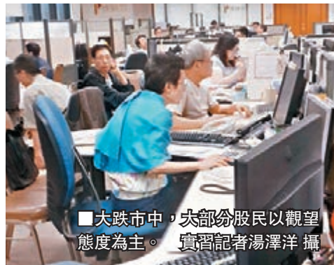
大市中，大部分股民以觀望態度為主。

香港文匯報訊(記者 梁偉聰、陳楚倩) 昨日恒指一度跌逾千三點，跌穿二萬五大關，二十大跌幅榜要跌至少三成「才有機會」上揚，全日217隻牛證打靶，是歷來第二多，可謂牛屍遍野，散戶輸到揚言上IFC天台見。香港討論區有人發帖稱，用220萬元買牛熊證(估計是買牛證)，結果一鋪清袋，已兩日未回家，並向網友說「再見」。但亦有散戶乘機「撈底」，豪擲20萬元買藍籌股。