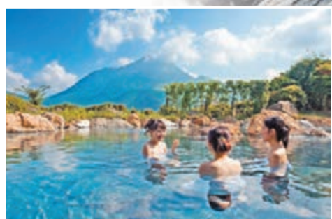
溫泉旅館禁紋身客，對外國人而言如同「趕客」。