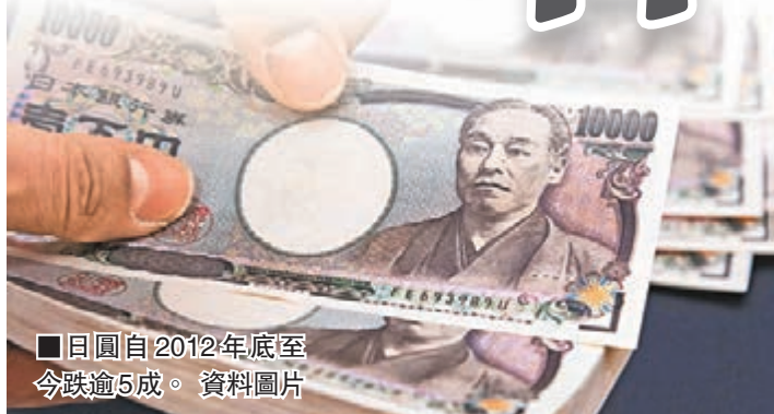
日圓自2012年底至今跌逾5成。資料圖片