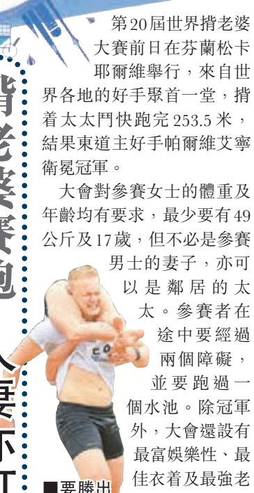
要勝出比賽絕對不易。

第20屆世界揸老婆大賽前日在芬蘭松卡耶爾維舉行，來自世界各地的好手聚首一堂，揸着太太鬥快跑完253.5米，結果東道主好手帕爾維寧奪得冠軍。