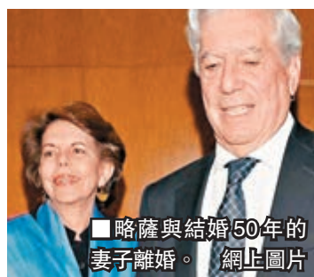
略薩與結婚50年的妻子離婚。

2010年諾貝爾文學獎得主、拉丁美洲文壇代表人物、79歲秘魯作家略薩，早前與結婚50年的70歲妻子離婚，轟動文壇，他近日再向西班牙娛樂八卦雜誌《Hola》承認，與叱咤拉美樂壇的西班牙男歌手Enrique Iglesias之母、64歲菲律賓名媛普賴斯勒關係「非常好」，已交往8個月之久，引起極大爭議。