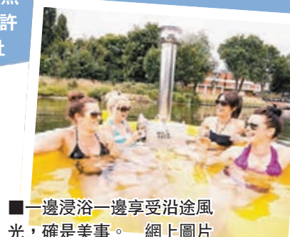
一邊浸浴一邊享受沿途風光，確是美事。

有沒有想過邊浸浴邊遊船河？荷蘭有人設計了一款水上大浴缸，能以時速4.8公里在水上移動，最大容量達1,800公升，可讓一班朋友同時在攝氏38度恆溫的暖水中浸浴。大浴缸售價3萬英鎊(約36萬港元)，免運費，在購物網站Firebox發售。