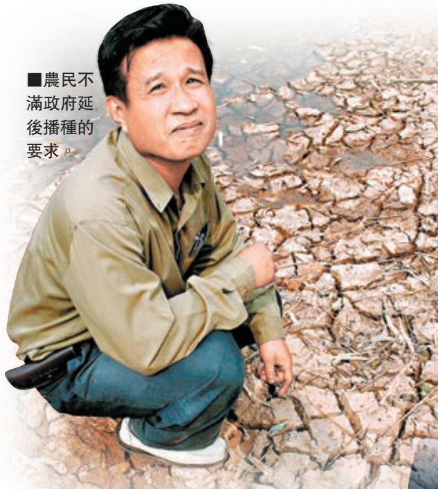
農民不滿政府延後播種的要求。