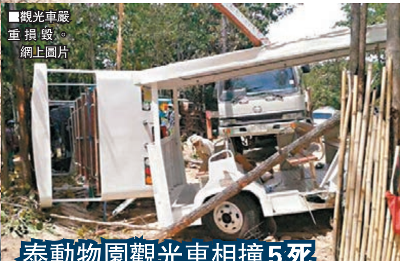
觀光車嚴重損毀。