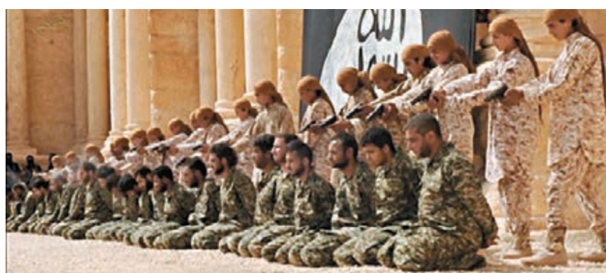
娃娃兵近距離處決25名敘軍士兵。