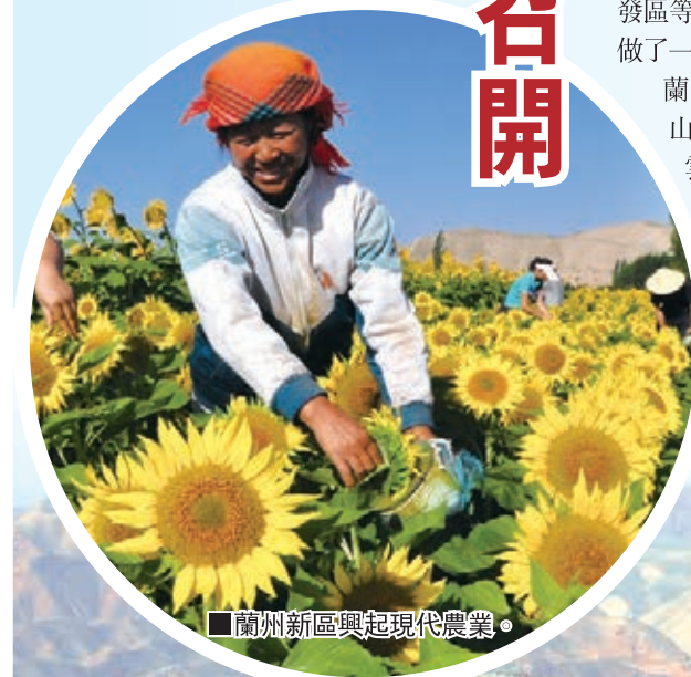
■蘭州新區興起現代農業。