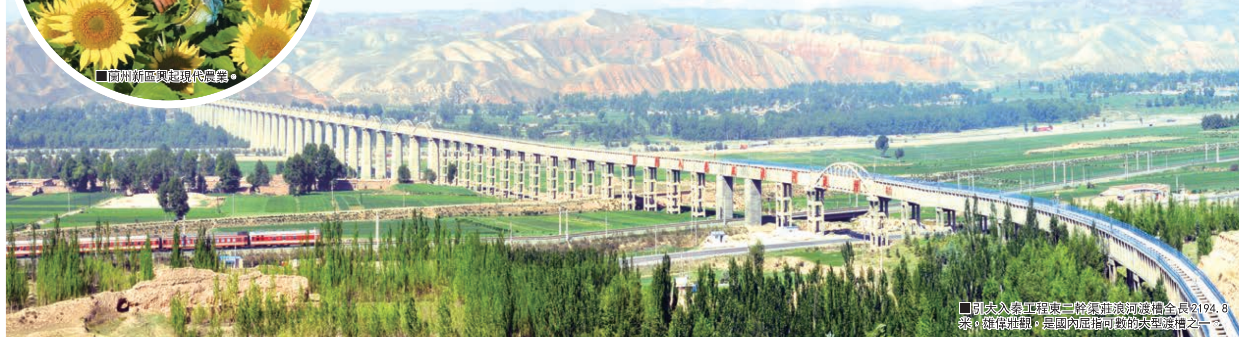
■引大入秦工程東二幹渠渠浪河渡槽全長2194.8米，雄偉壯觀，是國內屈指可數的典型渡槽之一。