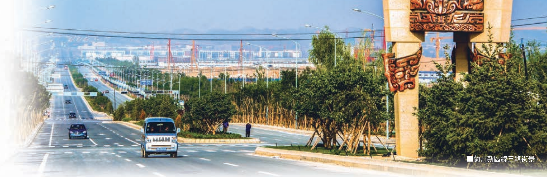
■蘭州新區緯三路街景

蘭州新區地處蘭州、西寧和銀川三個省會城市共生帶的中間位置，是「絲綢之路經濟帶」上的重要節點。這裡是國家向西開放的新門戶，也是中國西部與國內中原地區，以及國際交流往來的重要窗口。這裡空間開闊、沃野千里，擁有充足的土地資源。這裡交通便利，是規劃建設的全國交通樞紐，具有空港、鐵路、高速公路等立體交通綜合優勢。這裡風和日麗、日照充足，水資源豐富，具備良好的開發基礎和條件。