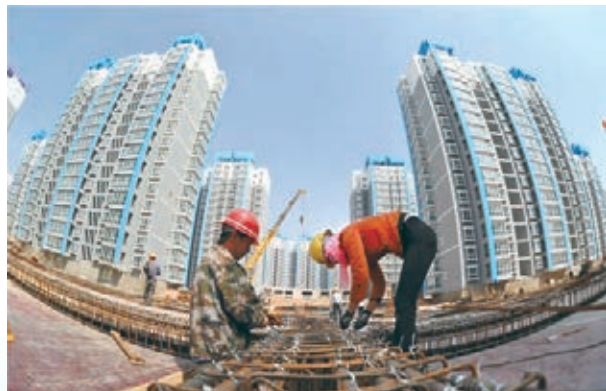
■建設中的蘭州新區保障性住房。

開發開放、合作共贏是我們共同的美好願望，蘭州新區熱忱歡迎各位企業家朋友到蘭州新區這片充滿商機、孕育希望的熱土參觀考察、洽談合作、投資興業，攜手開創共贏發展的美好未來。