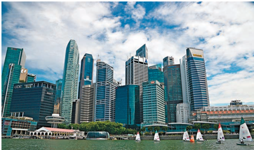
亞洲國家財政盈餘，企業盈利樂觀，高收益債受投資者歡迎。圖為新加坡市容。