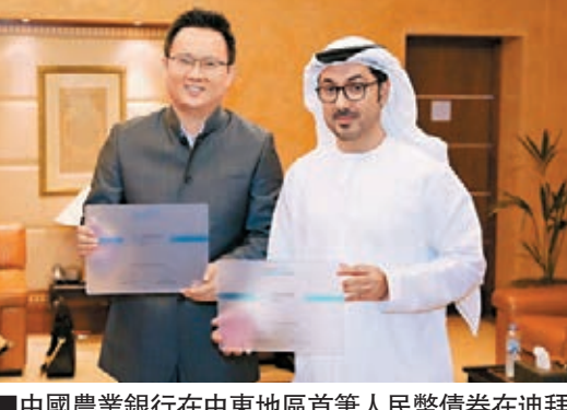
中國農業銀行在中東地區首筆人民幣債券在迪拜上市。