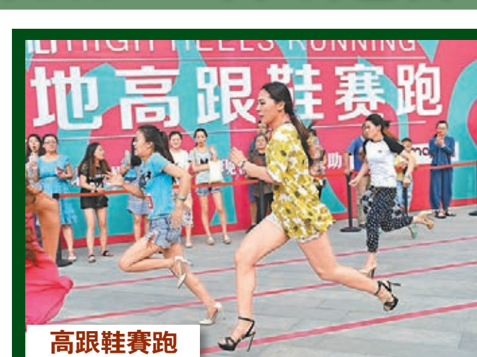
高跟鞋賽跑 山西太原某廣場7月3日舉辦高跟鞋賽跑，豐厚的獎品吸引了眾多男女青年報名參加。■文/圖：中新社

現在，優優已隨父親前往上海治病，趙月蘭在家募捐乞討，捐助的錢都寄去上海。她只希望有社會上的好心人幫幫優優，盡快把病治好，能早日和同齡人一樣進入課堂學習，健康快樂地成長。■實習記者 牛琰 江西報道