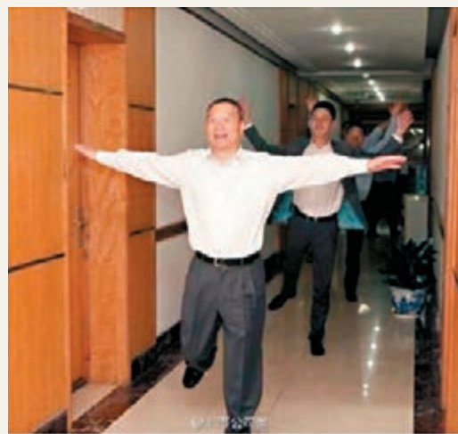
■有網民在微博曬出一張肖鋼做廣播體操的相片。

A股周二先暴跌後反彈, 波幅空前劇烈; 昨日大市又再大幅回落, 廣大散戶的情緒亦隨之高低起伏。一如既往, 大量爆笑段子爭相出爐。然而, 不少股民一邊冷嘲熱諷, 痛斥A股「根本就是賭場」, 一邊卻又在股市反彈之際羨慕眼紅, 忍不住重新入場搏殺, 企圖賺個滿堂紅。這種矛盾的心態, 本身也已成爲有識之士的笑柄。