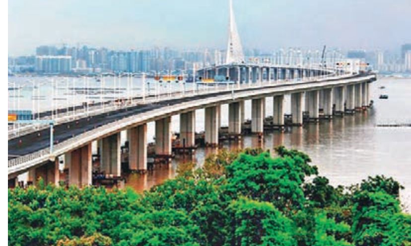
作為深港之間最大型的跨界基礎工程之一，深港西部通道開通已有8年。

香港文匯報訊(記者 李望賢 深圳報道) 作為深港之間最大型的跨界基礎工程之一，深港西部通道開通已有8年。廣東省深圳市審計局日前完成對西部通道深圳側六項工程的審計，發現部分項目未按規定進行招標，部分工程造價諮詢單位沒有嚴格審核工程造價，部分工程存在虛報工程量問題。根據審計監督條例，上述情況應給予行政處罰，目前深圳市審計局已移送建設行政主管部門進行處理。