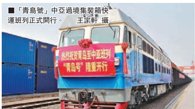
「青島號」中亞過境集裝箱快運班列正式開行。

據介紹，鐵路國際班列的優勢在於運輸時限較海運大幅縮短，而價格又遠低於空運，特別適合對運輸時限要求較高且相對大宗的高附加值產品的國際運輸。該班列的開行可將青島至歐亞俄東地區的物流時間大幅壓縮至12-18天。