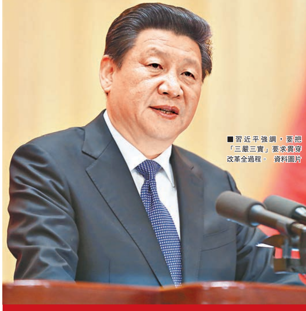
■ 習近平強調，要把「三嚴三實」要求貫穿改革全過程。 資料圖片

香港文匯報訊 據央視網報道，中共中央總書記、國家主席、中央軍委主席、中央全面深化改革領導小組組長習近平昨日下午主持召開中央全面深化改革領導小組第十四次會議並發表重要講話。他強調，領導幹部是否做到嚴以修身、嚴以用權、嚴以律己，謀事要實、創業要實、做人要實，全面深化改革是一個重要檢驗。要把「三嚴三實」要求貫穿改革全過程，引導廣大黨員、幹部特別是領導幹部大力弘揚實事求是、求真務實精神，理解改革要實，謀劃改革要實，落實改革也要實，既當改革的促進派，又當改革的實幹家。