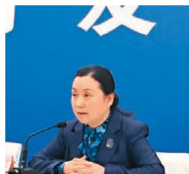
■全國人大常委會法工委副主任鄭淑娜。

香港文匯報訊（記者 劉凝哲 北京報道）中國國家安全法昨日高票通過全國人大常委會議表決，並於即日起正式實施。法律首次將港澳納入，強調香港對國家安全問題的義務與責任。全國人大常委會法工委副主任鄭淑娜就此表示，國家安全法不在港澳特區實施。法律對港澳特區和港澳同胞維護國家安全的責任提出原則要求是必要的，符合憲法和基本法的規定。「這是原則性的提法，如果要落實，就要落實在香港基本法第二十三條，要自行立法」，鄭淑娜說。