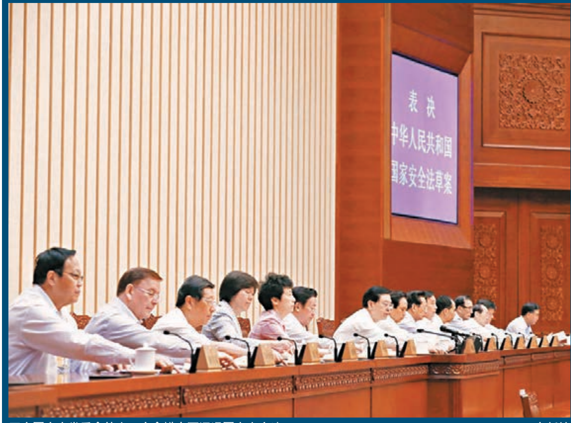
■全國人大常委會第十五次會議高票通過國家安全法。