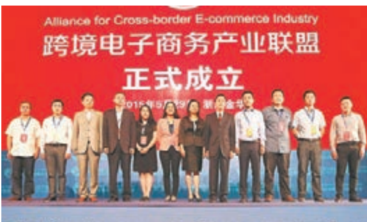
■5月29日，全國首個跨境電商產業聯盟成立。

據介紹，目前綜合試驗區的試點政策適用於在「單一窗口」平台登記備案的在杭州市註冊的各類市場主體，今後將擴展至在「單一窗口」平台登記