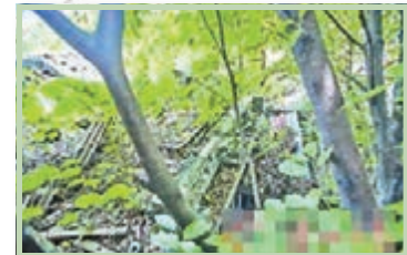
■李小龍祖居如今雜草叢生。廣州日報

另據了解，早在2011年，廣州荔灣區就有政協委員建議將李小龍祖居與附近的粵劇武打家曾經聚集的鑾輿堂連通開發，打造成粵劇展覽館和武術培訓基地。去年10月，荔灣區文廣新局曾在回應媒體時稱，李小龍祖居是荔灣區文物保護單位，接下來如何保護和修繕，暫無具體規劃。