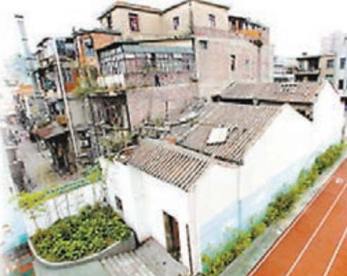
■李小龍祖居2007年之前曾有人住過，管理得也還好，那時候還沒有蛇出現。廣州日報