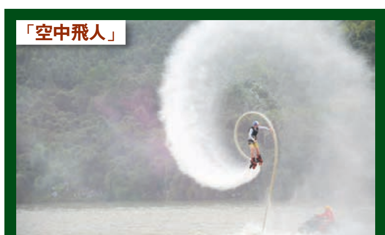
在四川省青神縣瑞峰鎮岷江河段，特技滑水隊員正在進行水上特技表演。30日，四川省青神縣第三十屆瑞峰龍舟文化節舉行，來自中國特技滑水隊的隊員上演的「空中飛人」，為當地上萬觀眾帶來了精彩的水上特技表演。