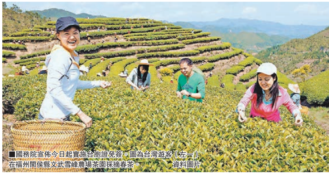
■國務院宣佈今日起實施台胞證免簽。圖為台灣遊客(左一)在福州閩侯縣文武峰農場茶園採摘春茶。

他表示，目前考量到機票成本等因素，公司尚未新推出大陸的短天期旅遊，但未來會觀察台胞證免簽後的市場發展，適時推旅遊套裝行程。