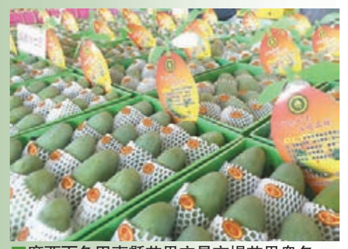
■廣西百色田東縣芒果交易市場芒果最多。

廣西百色芒果近年來因味香果靚而聲名鵲起，近日正值芒果上市季節，記者在該市田東縣芒果交易市場看到，包括桂七、台農品種在內的眾多芒果堆積成山。與傳統銷售模式不同的是，今年百色的芒果農戶紛紛借助互聯網，做起了電商。