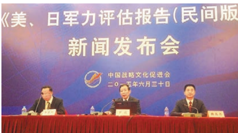
■中國戰略文化促進會昨日上午在京發佈《2014美、日軍力評估報告》。

《2014日本軍力評估報告》指出,2014年日本國防預算總額達4.9035萬億日圓,其中武器裝備採購和維護