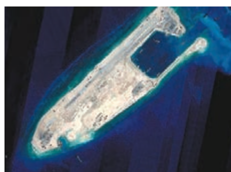
■中國在南沙群島部分駐守島礁上的建設已完陸域吹填工程。圖為此前發佈的完成陸域吹填工程後的永暑礁衛星圖片。 資料圖片

香港文匯報訊 據新華社報道,外交部發言人華春瑩昨日在例行記者會上表示,中國在南沙群島部分駐守島礁上的建設已完陸域吹填工程,下階段將開展滿足相關功能的設施建設。