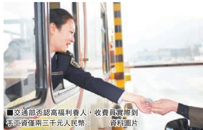
■交通部否認高福利養人,收費員實際到手工資僅兩三千元人民幣。 資料圖片

香港文匯報訊(記者馬琳北京報道)收費公路連年虧損引發公眾諸多質疑,運營成本高居不下是其中之一。對此,交通運輸部官員表示,運營成本不只是人工成本,還包括水電、事故清障等11項費用,不存在高福利養人的情況。