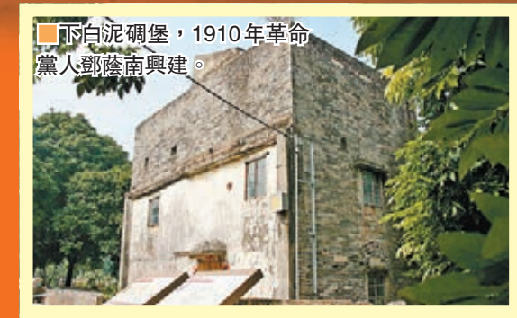
下白泥砲堡，1910年革命黨人鄧蔭南興建。