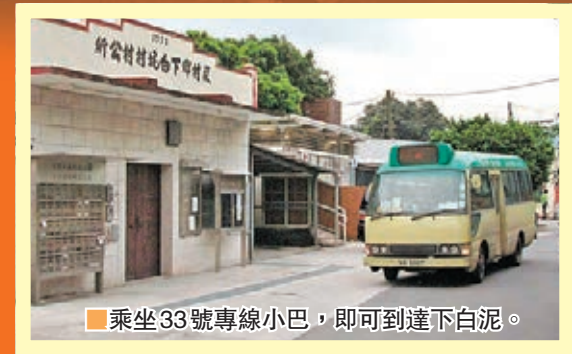
乘坐33號專線小巴，即可到達下白泥。

交通 搭乘西鐵線或巴士至元朗市中心，再行至泰豐街搭乘33號專線小巴，於鴨仔坑釣魚場下車。