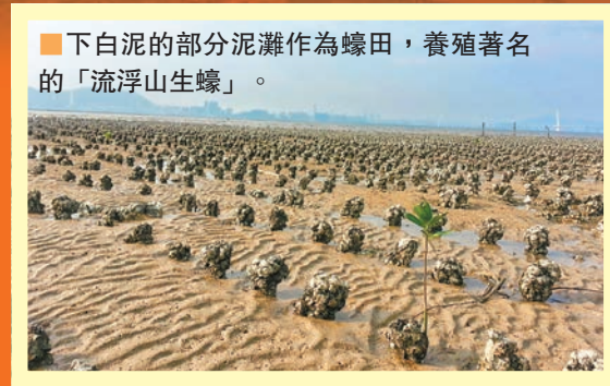
下白泥的部分泥灘作為蠔田，養殖著名的「流浮山生蠔」。