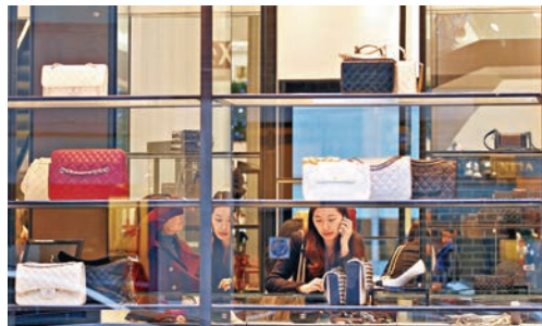
中國遊客在英國倫敦名店購物。資料圖片

高仰遠指出，歐元持續下跌，大大促進了歐洲旅遊業。來自世界其他地區去歐洲旅遊購物的人數持續