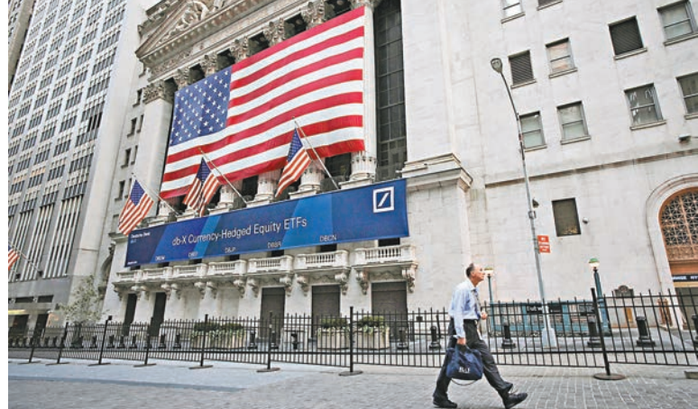
美國經濟下半年動力料增強,有利健康護理及科技產業股上升。圖為美國紐約證券交易所。

德意志銀行統計,受惠內需增長、利潤增加、較高營運槓桿及匯率順風,道瓊歐洲600指數中已公布季報的95%企業中,銷售優於預期比例達65%,是2012年第一季來最高,盈利增長優於預期比率也有54%,預測這種情況將延續至今年底,並小幅上調未來12個月盈利預測。彭博資訊統計市場預測道瓊歐洲600指數今年兩年盈利增長率分別為