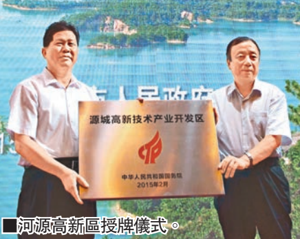
河源高新區授牌儀式。

廣東河源近日舉行國家級高新區授牌儀式暨招商推介活動,近500名企業家到場。活動共達成意向投資項目88個,總金額509億元(人民幣,下同);簽約項目81個,涉及電子信息、裝備製造、食品飲料、金屬製品、清潔能源、資源精深加工、電子商務、商貿物流等各大領域,合同投資額達382億元,建成投產後預計可實現年產值500億元以上。