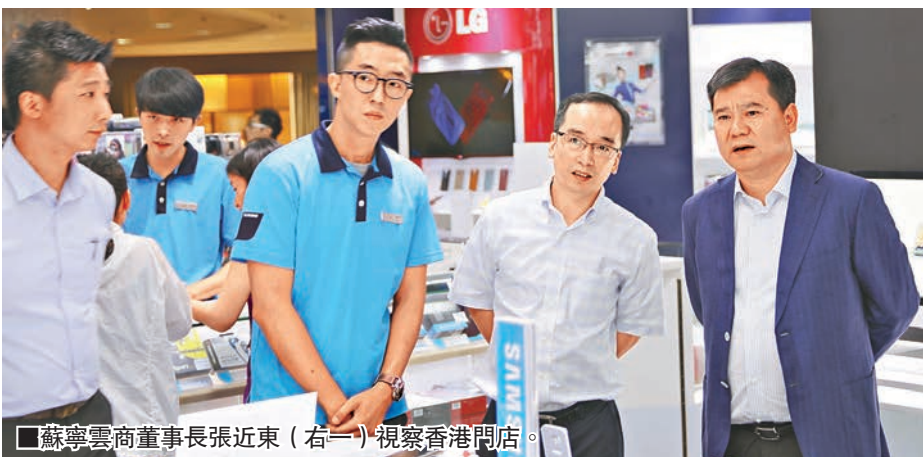
蘇寧雲商董事長張近東(右一)視察香港門店。

依托蘇寧在香港的零售平台,蘇寧易購香港館的品類不斷豐富,銷售一路看漲。就在今年愚人節促銷當天,蘇寧易購香港館一天賣空了41個集裝箱,而即將到來的