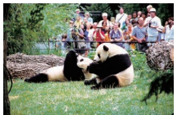
四川名片大熊貓吸引中外遊客駐足。