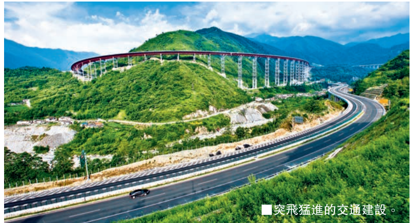
突飛猛進的交通建設。

據悉，今年四川省將進一步投資建好各類開放口岸和海關特殊監管區域，積極開展投資、貿易便利化等改革試點；擴大准入領域，簡化核准手續，提升外商投資吸引力；推進四川全域通關一體化建設，提升對外貿易便利化水平。