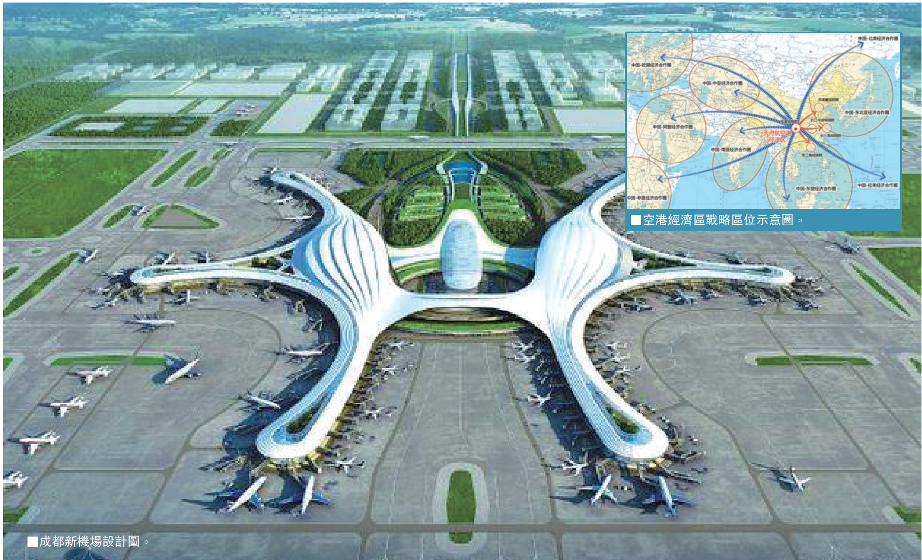
成都新機場設計圖。