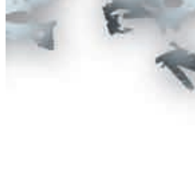
法恐襲兇手與頭顱自拍

法國當局繼續調查氣體工廠恐襲案，透露疑犯薩勒希在被捕前，曾與被他斬首的頭顱自拍，並將照片經手機通訊程式WhatsApp，傳到一個加拿大手機號碼，收件者身處敘利亞，加國公共安全部確認正協助調查。調查員又表示，薩勒希已供認犯案詳情，將把他移送巴