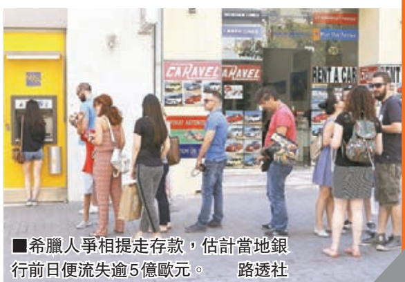
希臘人爭相提走存款，估計當地銀行前日便流失逾5億歐元。路透社

廣播公司(BBC)訪問時指，債權人向希臘開出的方案效力只到明天為止，意味若局勢沒有變化，希臘人屆時只會就一份失效提案投票。 希臘人一日提款43億 希臘危機前景不明朗，導致希臘人爭相提走存款，估計當地銀行業單是前日便流失逾5億歐元(約43億港元)，35%提款機更一度沒現鈔供應。歐洲央行昨日召開緊急會議，決定暫時維持對希臘的緊急流動性援助(ELA)，繼續為希臘銀行業「吊命」。 ■英國廣播公司/路透社/法新社