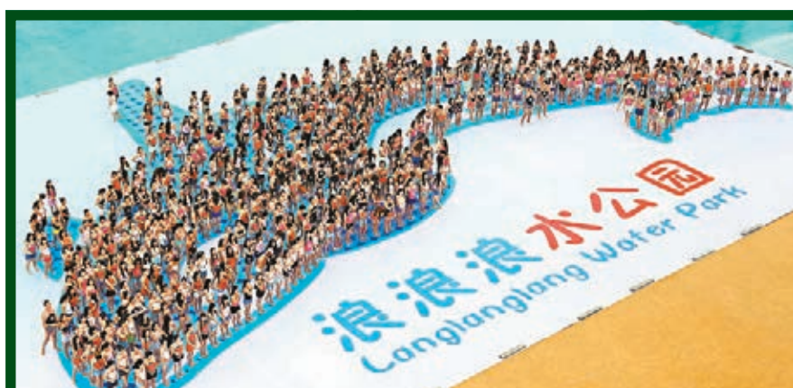
組「鯨魚」倡環保。

截止日期為今年12月15日。據活動承辦單位——湖南藝行天下文化教育有限公司負責人透露，目前各高校學生與老師的參與熱情非常高，經過前期摸底，屆時前往通道侗寨寫生創作的學生人數預計在2,000人以上，將在各大高校形成一股「寫生到通道」的熱潮。