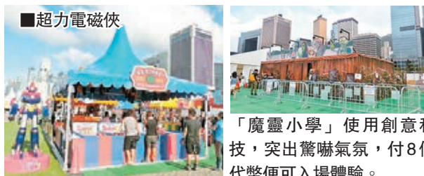
吸蕉大笨象，項明生一嘗銀TINO滋味。

而且，昔日的真象TINO，變成吸蕉大笨象，結合科技設計，化身成機械TINO，其嘴部懂得自動開合，可讓人餵食香蕉，懂得噴水、眨眼、發聲及肚皮顫抖等動作，TINO吃完仿香蕉後，更會自動排便，活現大象的生活習慣。