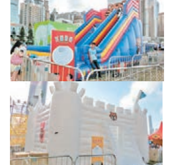
這個吹漲動物園，較小的小朋友可遊玩。