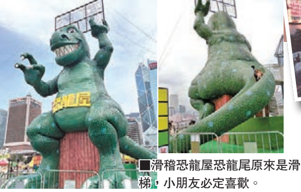
滑稽恐龍屋恐龍尾原來是滑梯，小朋友必定喜歡。