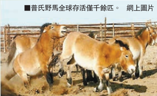
普氏野馬全球存活僅千餘匹。網上圖片

記者近日從甘肅安西極旱荒漠國家級自然保護區獲悉，普氏野馬族群再添5位新成員，是保護區歷年來產駒數量最多的一次，族群正在不斷壯大。