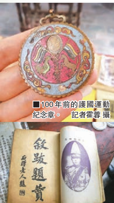
100年前的護國運動紀念章。

今年是中國近代史上宣佈建立「雲南都督府」的護國運動100周年紀念，也是護國運動發起人、滇軍創始人唐繼堯逝世88周年。日前，《唐繼堯珍藏精品文物展》在雲南昆明首次進行為期一個月的展出。展出的26件文物，均為清代的書畫精品，包括乾隆年間進士、曹雪芹摯友、雲南周於禮的十部墨跡冊頁等，都是唐繼堯生前珍藏，每件作品均有「唐繼堯聯帥公館」註明編號和鋼印。