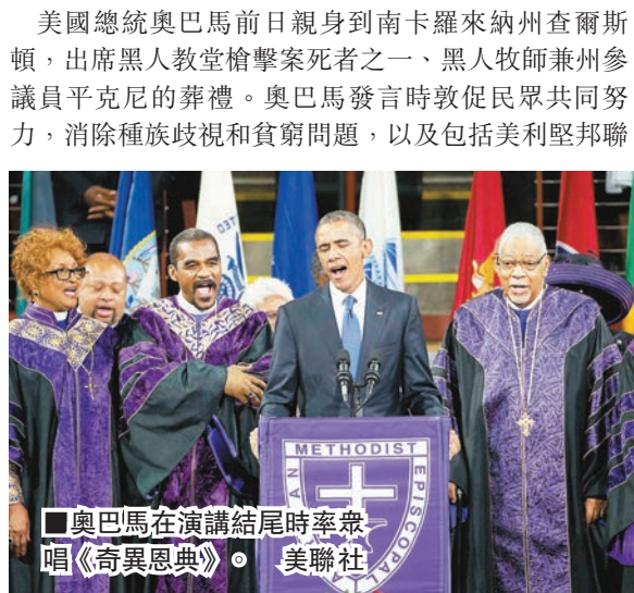
奧巴馬在演講結尾時率眾唱《奇異恩典》。

美國總統奧巴馬前日親身到南卡羅來納州查爾斯頓，出席黑人教堂槍擊案死者之一、黑人牧師兼州參議員平克尼的葬禮。奧巴馬發言時敦促民眾共同努力，消除種族歧視和貧窮問題，以及包括美利堅邦聯