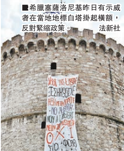
希臘塞薩洛尼基昨日有示威者在當地地標白塔掛起橫額，反對緊縮政策。

這項由歐盟民調處(Eurobarometer)進行的民意調查，同時問到希臘人「歐盟對你來說有什麼意義」，最多人認為歐盟等同於「在歐盟國家內自由旅遊、讀書及工作」，其次則是歐元。對南歐多個曾經歷獨裁統治的國家而言，歐盟曾是它們的美夢，象徵了和平