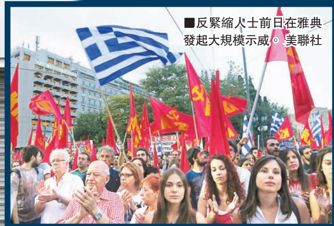
反緊縮人士昨日在雅典發起大規模示威。