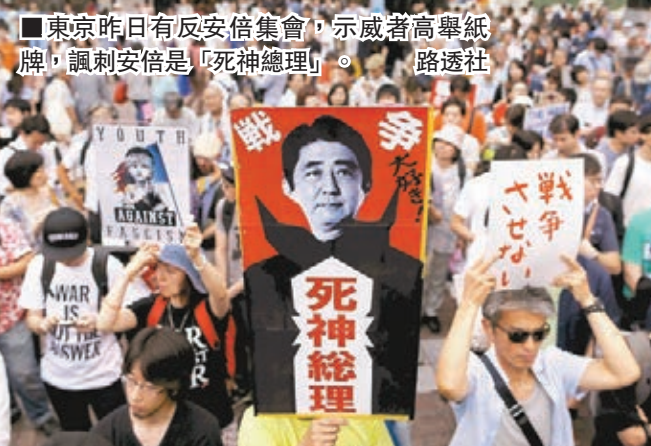
東京昨日有反安倍集會，示威者高舉紙牌，諷刺安倍是「死神總理」。

日本自民黨議員在一次對話會上，宣稱要「封殺新聞媒體異見言論」的風波繼續發酵。雖然自民黨已把擔任對話會代表的青年局局長木原稔免職，禁止他一年內擔任任何黨內職位，同時對3名涉事議員發出嚴重警告，但仍未能平息外界不滿。在野黨批其態度反映大權在握的首相安倍晉三走向獨裁，準備向安倍追究責任。