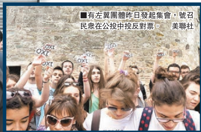
有左翼團體昨日發起集會，號召民眾在公投中投反對票。