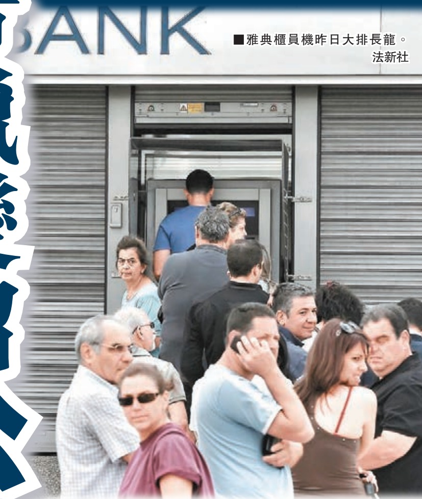
雅典櫃員機昨日大排長龍。