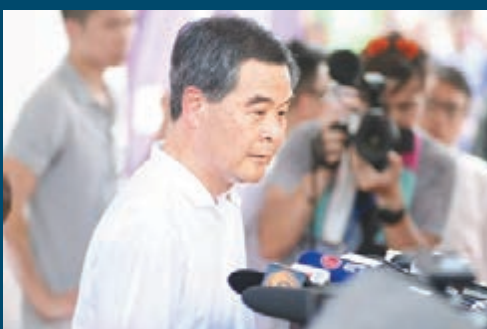
梁振英昨日表示，將約見立法會各黨派，商討集中精力做好經濟民生工作。

香港文匯報訊(記者 李自明、葉佩妍)香港政改爭議告一段落，特區政府今後將聚焦處理經濟民生議題。行政長官梁振英昨日與自由黨議員會晤，聽取他們對經濟民生的意見，並正陸續約見立法會各個黨派議員。梁振英昨日表示，特區政府希望能夠和立法會各個黨派包括反對派，共同商討未來兩年如何集中精力做好經濟和民生工作，期望集思廣益，陸續落實可行建議。