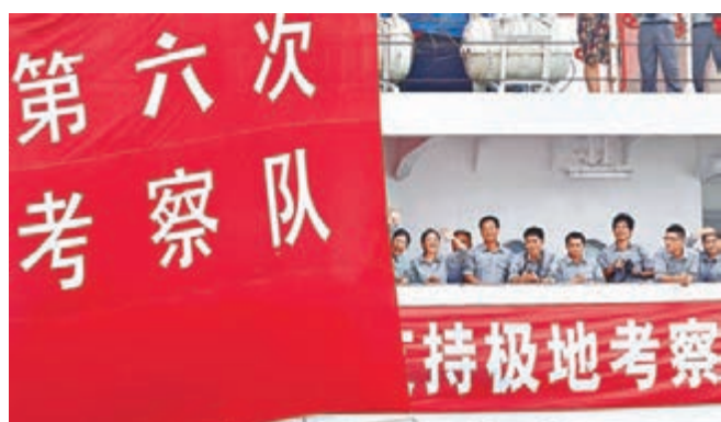
■中國「雪龍」號赴北極考察，是繼2013年中國獲得北極理事會正式觀察員國身份後，中國組織的首次北極科考。 資料圖片