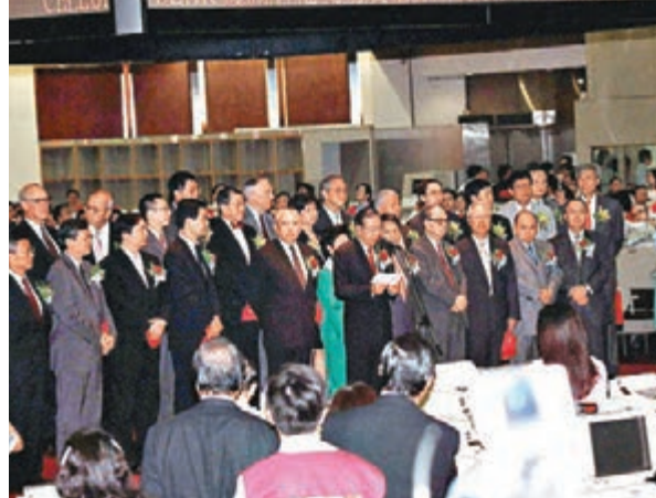
2000年6月27日,港交所正式掛牌上市。資料圖片

香港文匯報訊(記者 周紹基)港交所(0388)今舉行慶祝上市15周年酒會,翻查記錄,於2000年6月27日以介紹形式上市的港交所,上市時每股定價為3.88元,到了上周五收報283.2元,股價累升約72倍,持股