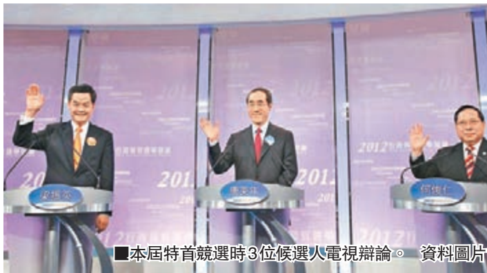
■本屆特首競選時3位候選人電視辯論。資料圖片