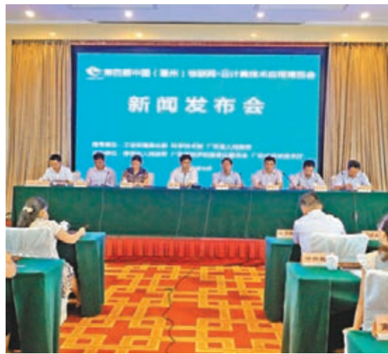
第四屆惠州雲博會誠邀國內外客商參展。

香港文匯報訊(記者余麗齡惠州報導)昨日，第四屆中國(惠州)物聯網·雲計算技術應用博覽會(以下簡稱「雲博會」)新聞發布會在